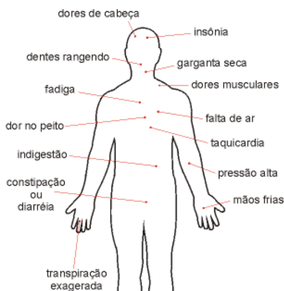
Figura 1 – Estresse, Impacto no Corpo